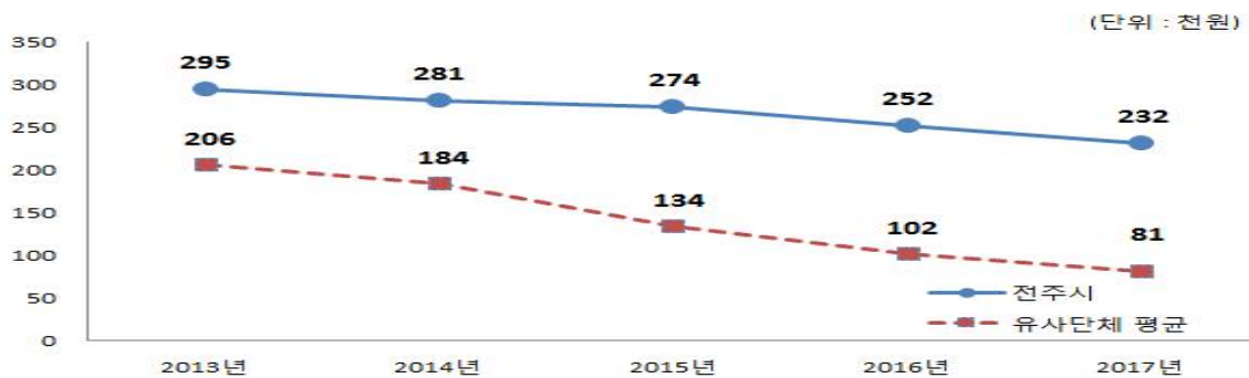
유사 지방자치단체와 주민 1인당 채무 비교